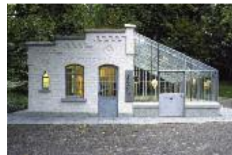
Original heute im Bad Cannstatter Kurpark

Das Gartenhäuschen ist heute eine liebevoll original- und detailgetreu eingerichtete Gedächtnisstätte. Hier werden die ersten Schritte zur Erfindung des Benzinmotors ausgestellt und die Daimlersche Vision für Fahrzeuge zu Wasser, zu Lande und in der Luft einen transportablen Universalmotor zu konstruieren, ist in den Räumlichkeiten auch heute noch spürbar.